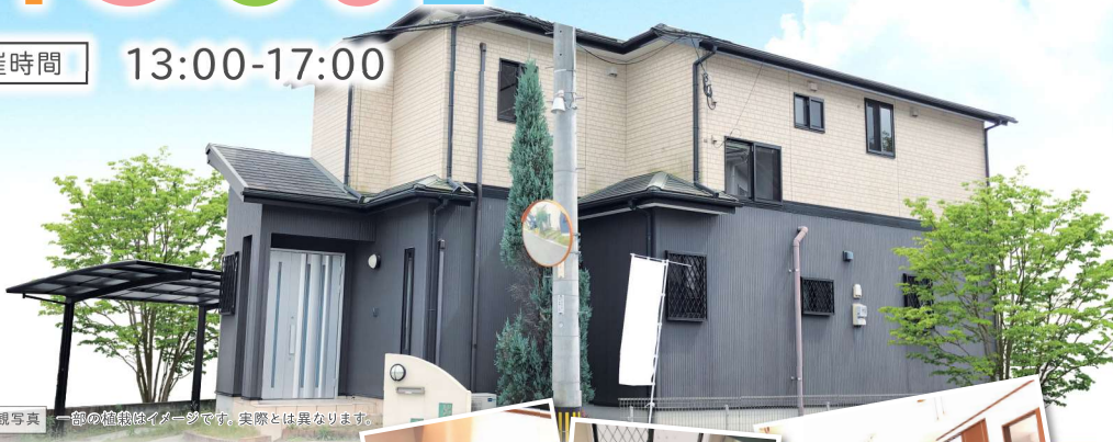
現地外観写真 一部の植栽はイメージです。実際とは異なります。